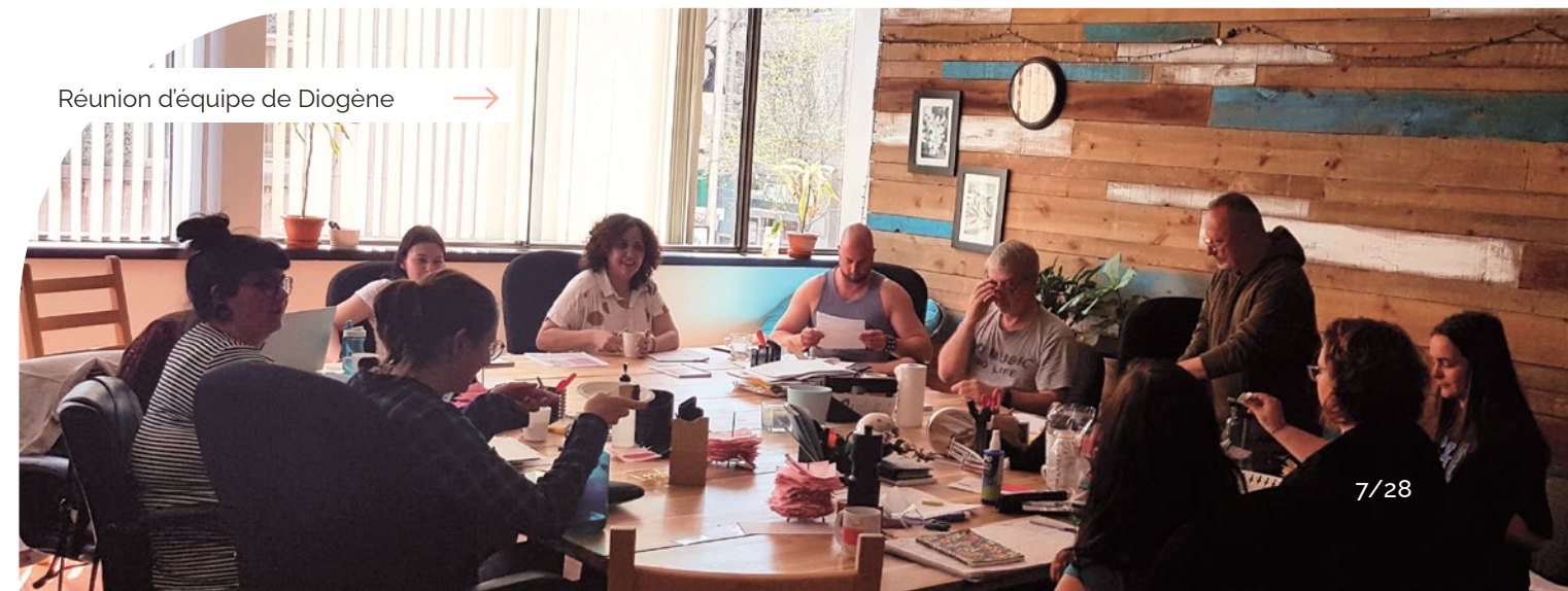
Réunion d'équipe de Diogène →

L'équipe de Diogène travaille à renforcer la dignité et l'autonomie des participant·es de nos divers services en créant un environnement favorisant l'autodétermination et la prise de décisions selon des choix éclairés.