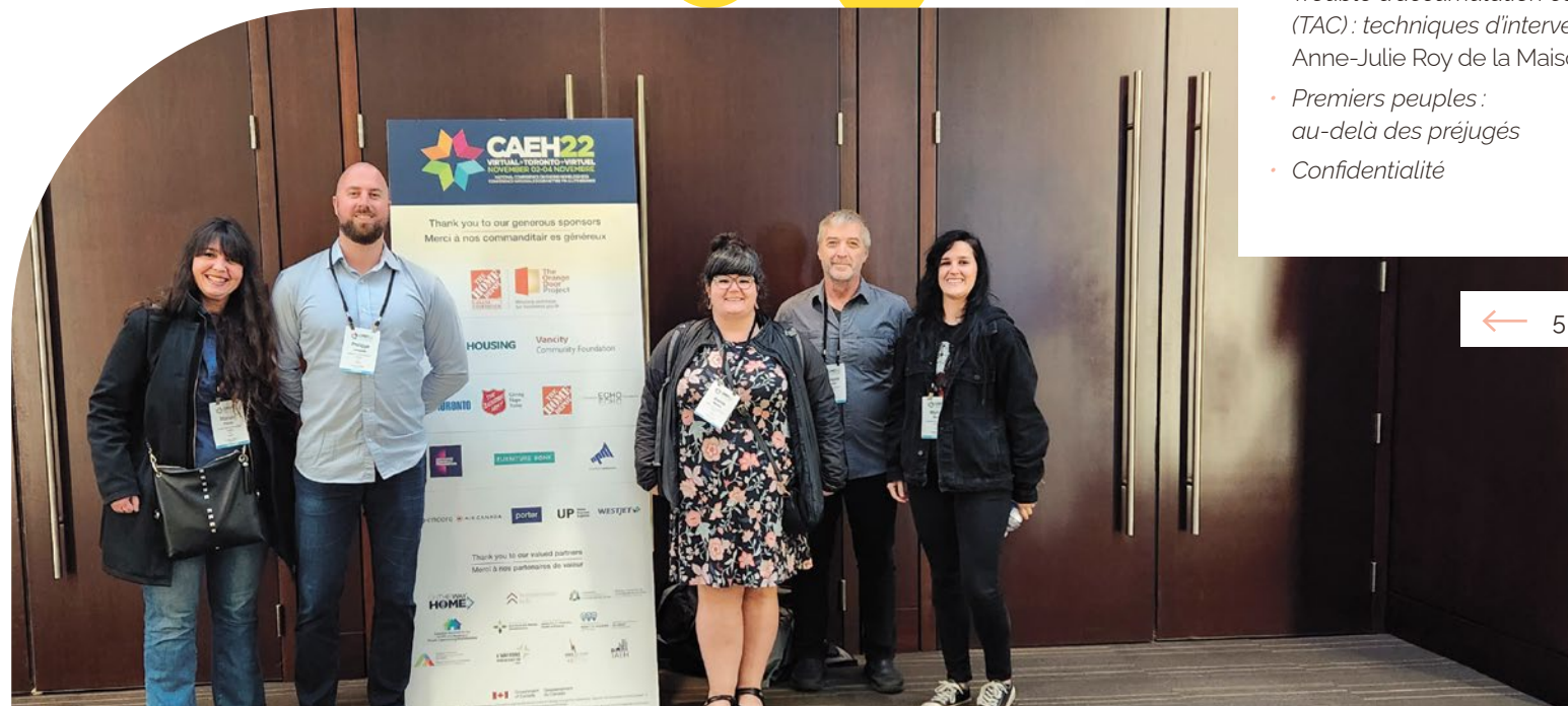
← 5 intervenant-es ont participé à la conférence de l'ACMFI à Toronto